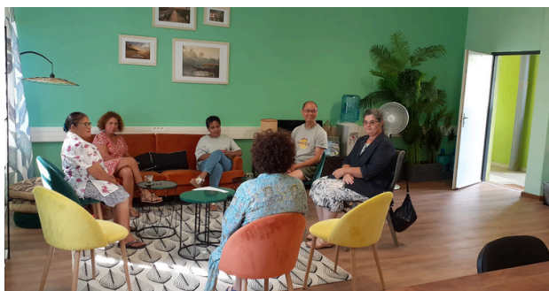
Un café des aidant.es organisé à l'Espace Reydellet à Saint-Denis

Les cafés sont des lieux, des temps et des espaces d'information, de rencontres et d'échanges, animés par un travailleur social et un psychologue ayant une expertise sur la question des aidants. Les paroles recueillies lors des ateliers montrent le bien-être qu'ils procurent aux participant.es.