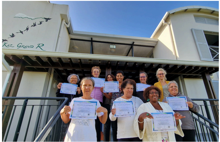
Les aidant.es reçoivent une attestation de participation à la Formation Gestes et Postures

Ce que les aidants ont le plus apprécié : « la solidarité », « mettre des mots, du sens dans nos ressentis ».